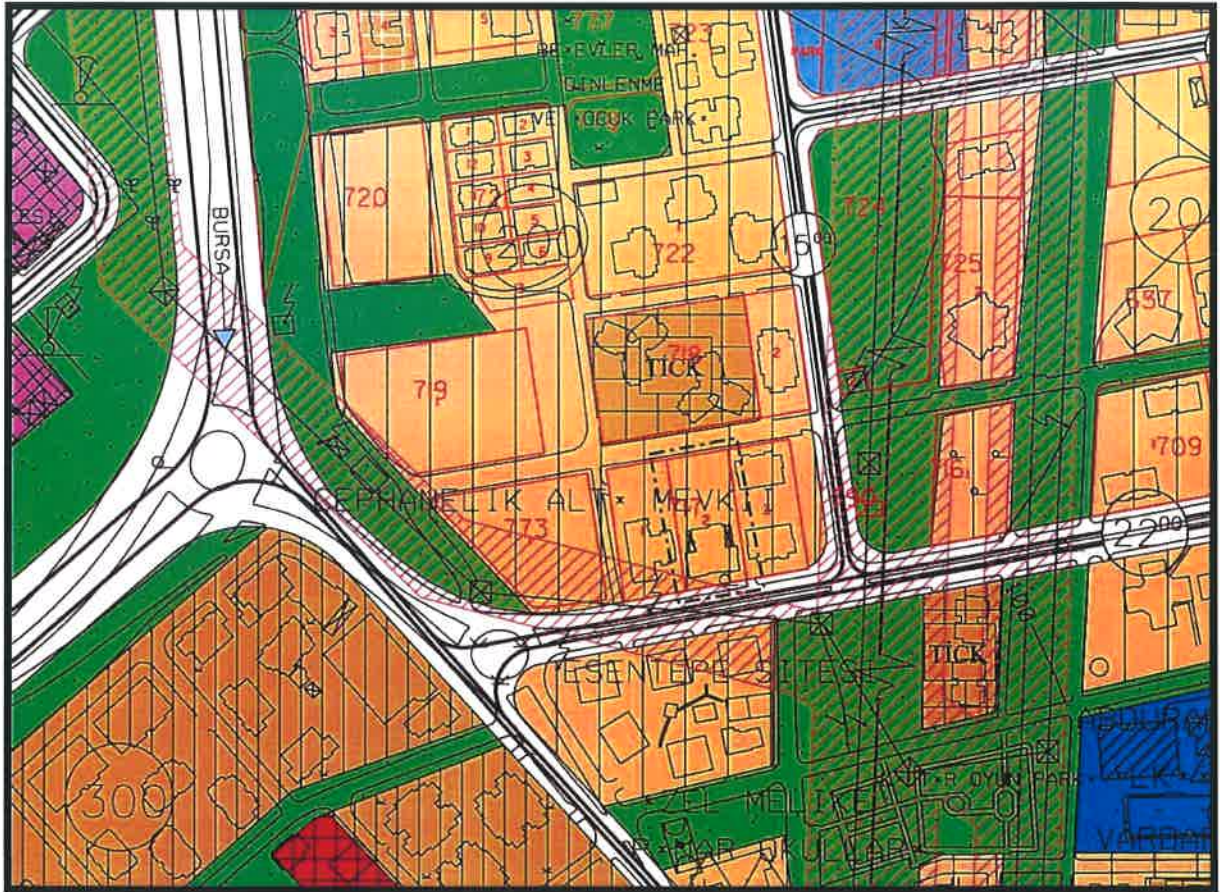
Yürürlükteki Nilüfer 1/5000 Ölçekli Nazım İmar Planı Örneği